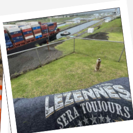
Canal de Panama | Natacha