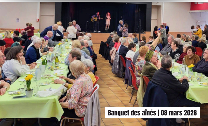
Banquet des aînés | 08 mars 2026