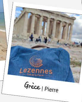
Grèce | Pierre