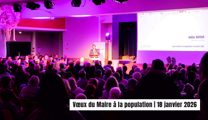
Vœux du Maire à la population | 18 janvier 2026