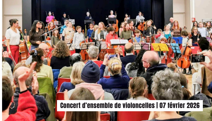
Concert d'ensemble de violoncelles | 07 février 2026