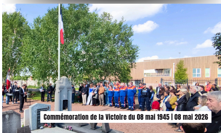
Commemoration de la Victoire du 08 mai 1945 | 08 mai 2026