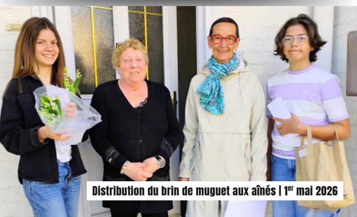
Distribution du brin de muguet aux aînés | 1 er mai 2026