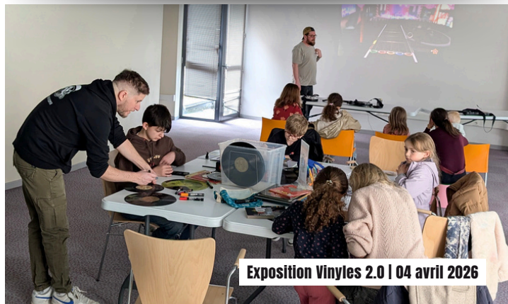
Exposition Vinyles 2.0 | 04 avril 2026