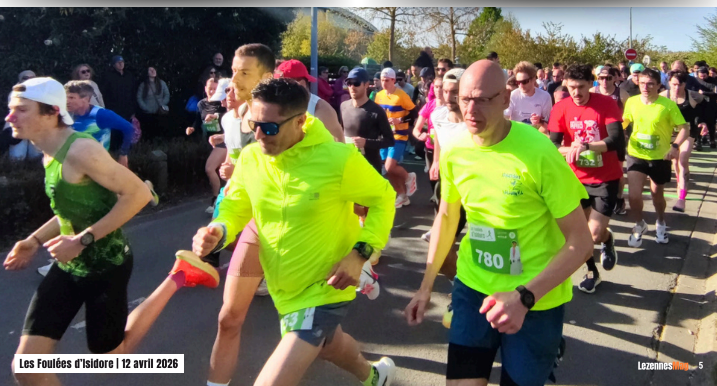
Les Foulées d'Isidore | 12 avril 2026