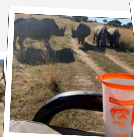
Zimbabwe | Marie-Hélène