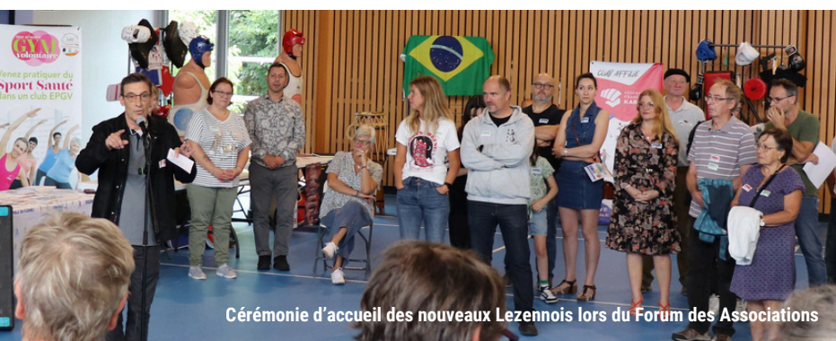
Cérémonie d'accueil des nouveaux Lezennois lors du Forum des Associations